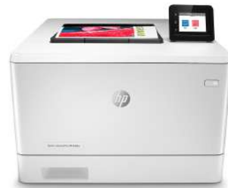
Impresora HP LaserJet Pro a color M454dw

Impresora con seguridad dinámica habilitada. Para ser exclusivamente utilizada con cartuchos que utilicen un chip original de HP. Es posible que no funcionen los cartuchos que no utilicen un chip de HP, y que los que funcionan hoy no funcionen en el futuro. Obtenga más información en: http://www.hp.com/go/learnaboutsups