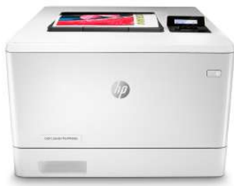
Impresora HP LaserJet Pro a color M454dn

El éxito profesional es sinónimo de una forma de trabajo más inteligente. La impresora HP Color LaserJet Pro M454 se ha diseñado para que puedas centrarte más en el crecimiento de tu empresa y situarte un paso por delante de la competencia.